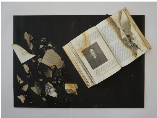
Abbildung der Arbeit: