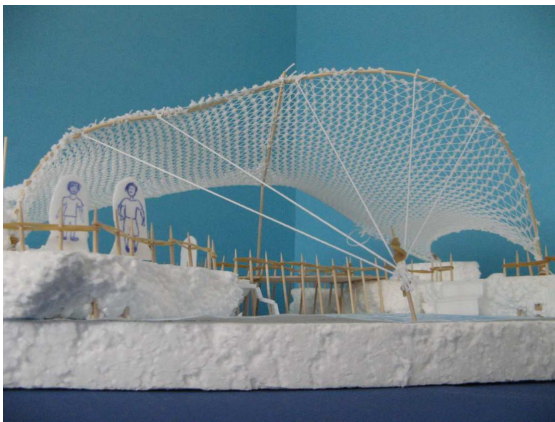
Abbildung der Arbeiten: